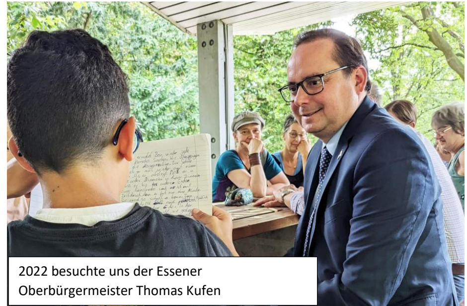
2022 besuchte uns der Essener Oberbürgermeister Thomas Kufen

Ich bin gespannt, was wir dabei in der Natur, um uns, an und in uns und in all den anderen entdecken werden!